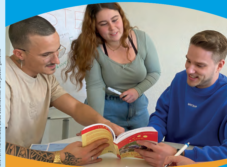
Im Text wird die weibliche Form verwendet; beide Geschlechter sind jedoch gemeint.

step systematisches training für eltern & pädagogen®