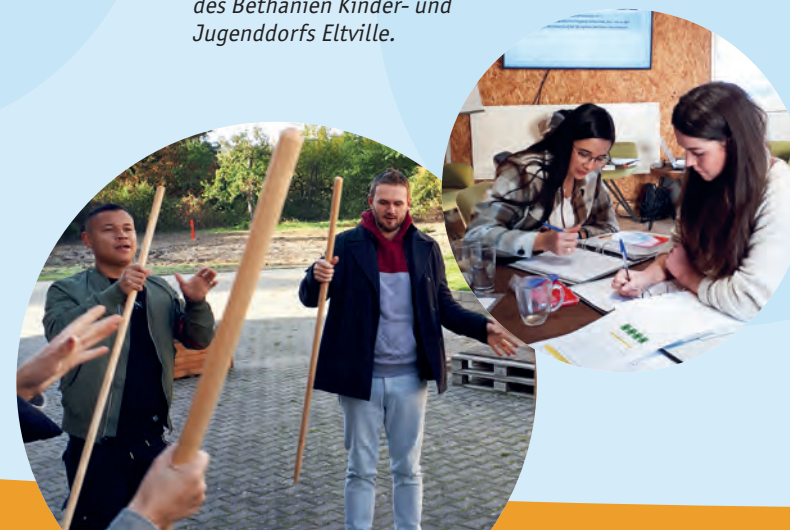
Abb.: STEP Weiterbildung des Bethanien Kinder- und Jugenddorfs Eltville.

Die Wirksamkeit des STEP Konzepts wurde durch die wissenschaftliche Evaluation von Klaus Hurrelmann, Professor für Sozial- und Gesundheitswissenschaften, bestätigt. Das STEP Konzept wurde von „Communities That Care“ (CTC) mit der Höchstpunktzahl bewertet und wird von der Schweizerischen Gesundheitsstiftung RADIX als Präventionsprogramm empfohlen.